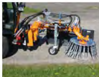
Her mont. med støttehjul