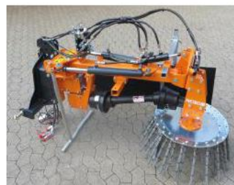
UK 625 MDS