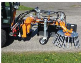
Her mont. med støttehjul