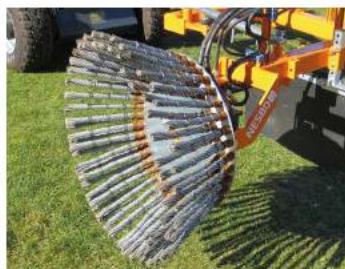
UK 725 R/L kan arbejde lodret